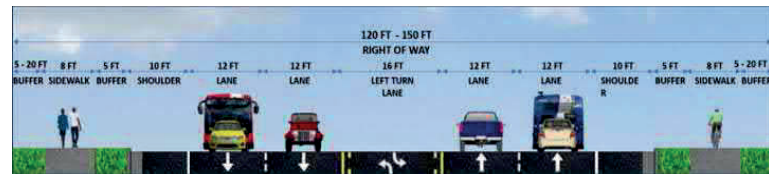
Sección Propuesta de la Carretera